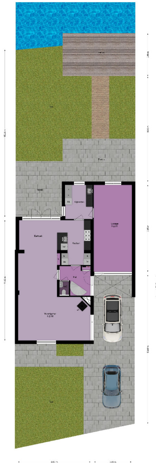
SITUATIE DE RUYTERLAAN 26 BENNEBROEK Aan de maatvoering kunnen geen rechten worden ontleend